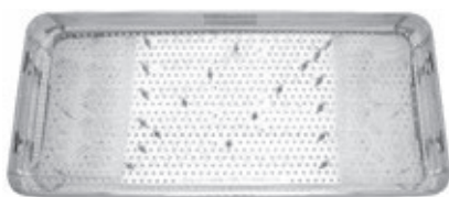
397 129 69 6230 Síto pro dlahy femorální distální 540 × 240 × 50 mm bez implantátů

Sieve for distal femoral plates 540 × 240 × 50 mm excluding implants