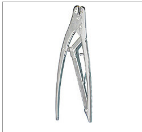
))) Drahtschneidezange Kat.-Nummer 200-112 (für sMART Nagel Ø2mm-Ø3mm)