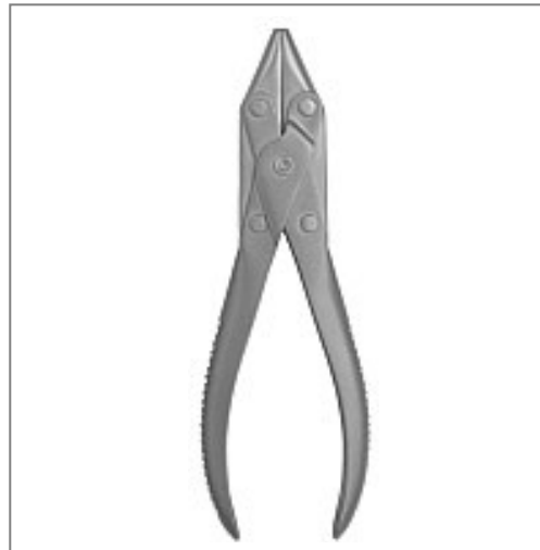
))) Nagelhaltezeange Kat.-Nummer 200-111