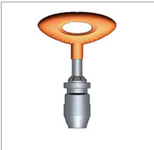
))) Spannfutter Kat.-Nummer 200-110