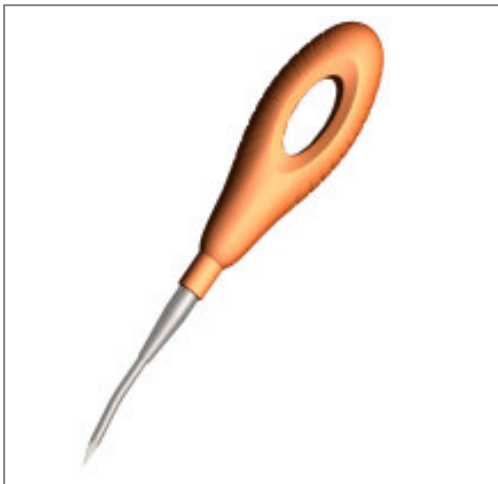
))) Pfriem Ø 4mm Kat.-Nummer 203-106