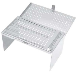
397 129 69 6392 Schraubhalter für die winkelstabile Knochenschrauben 5 214 × 126 × 120 mm ohne Implantate

Das Instrumenteset ist für die geraden Femurplatten 9–20 Öffnungen (10×1 Stk.), proximale Femurplatte, rechts 2–20 Öffnungen (10×1 Stk.), proximale Femurplatte, links 2–20 Öffnungen (10×1 Stk.), Fassungen 1 (3 Stk.), Fassungen 2 (6 Stk.), Fassungen 3 (3 Stk.) und Fixierschraube für die Fassung (10 Stk.).