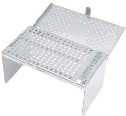
397 129 69 6391 Schraubhalter für die winkelstabilen Knochenschrauben 4,5 214 × 126 × 120 mm ohne Implantate