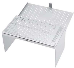
397 129 69 6390 Schraubhalter für die winkelstabilen Knochenschrauben 5/3,5 214 × 126 × 120 mm ohne Implantate